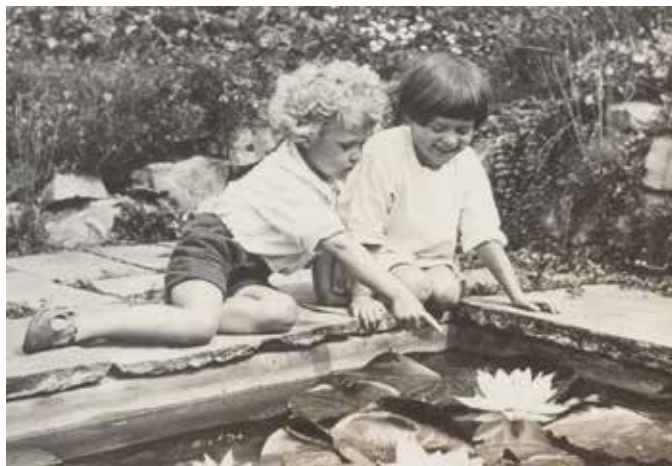
Kinderen poseren bij de waterlelies in een rechthoekige vijver (Anoniem, 1916-1927)

en gladde wateroppervlak. Ook in grachten en zichtkanalen was beplanting niet gewenst. Schrijver en landgoedeigenaar Pieter de la Court (1664-1739) voorziet hoge schoonmaakkosten en ervaart 'begroeide wateren voor het gezigt zeer oncierlijk'. Hij adviseert om het water regelmatig op te schonen om van deze 'grond-vuilnisse of groente' af te komen.