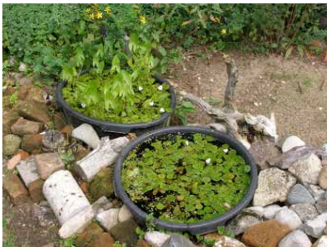
'Tiny Pond' in metselkuipen

Hoewel de tuinen tegenwoordig meestal nog kleiner van afmeting zijn, is een kleine vijver nog wel in te passen. Het is een uitdaging om genoeg tijd te besteden aan het maken van een mooie overgang tussen water en land. Weersta de drang naar bijzondere waterplanten en kies voor inheemse soorten. Uitheemse planten, veelal afkomstig uit de aquariumhandel zijn helaas maar al te vaak invasief. Als knipoog naar het verleden is het verleidelijk om te kiezen voor een dubbelbloemige dotter.