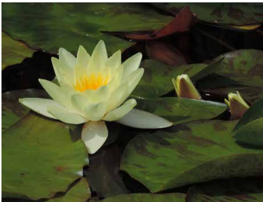
Nymphaea 'Marliacea Chromatella'