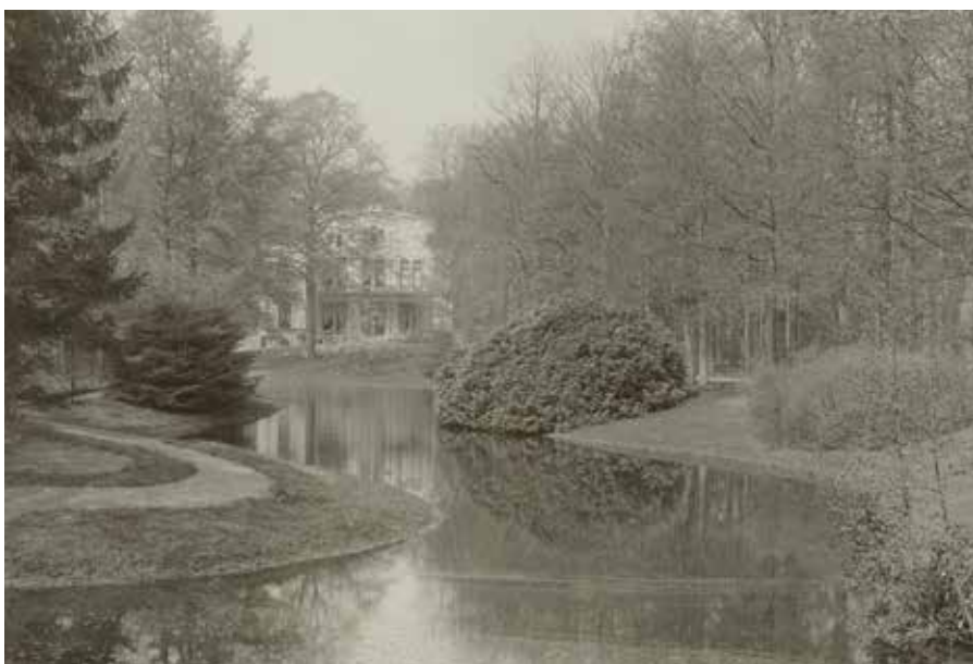
Gezicht op landhuis De Wildbaan, Driebergen. (Anoniem, tussen 1903 - 1907)

Vanaf de periode van de Land- schapsstijl (circa 1750) lieten welgestelde eigenaren hun rechtlijnige watergangen vergraven tot poëtisch