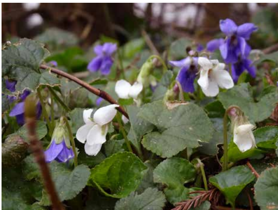
Maarts viooltje in twee kleuren onder de haag van Kasteel Sypesteyn, Loosdrecht

De bloemen van Maarts viooltje zijn meestal blauw, daarnaast zijn van oudsher witte, roze en dubbelbloemige selecties bekend. Petrus Nyland noemt witte en blauwe, 'enckelde en dubbelde' .